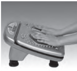
Hand & Handfläche